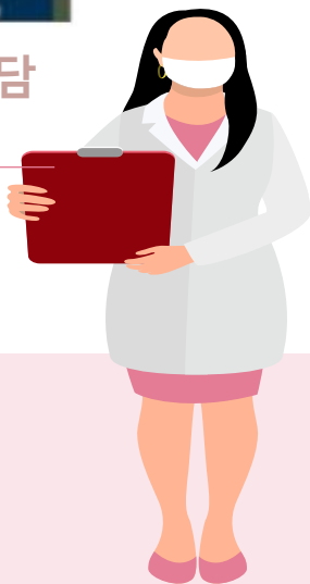
격리장소 이탈 시, 전담 공무원에게 알림